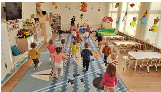
Żłobek Miejski „Kolorowe Nutki”

W 2024 roku miasto zapewniło kompleksowy system opieki nad dziećmi do lat 3, obejmujący zarówno publiczne, jak i niepubliczne placówki. Żłobek Miejski „Kolorowe Nutki” dysponował 272 miejscami, a dodatkowo niepubliczne żłobki oraz dzienni opiekunowie oferowali kolejne miejsca w ramach prywatnych inicjatyw. W sumie w Krośnie dostępnych było 420 miejsc, co pozwalało zapewnić opiekę 1/3 dzieci w tym wieku, w naszym mieście. Krosno dbając o swoich najmłodszych mieszkańców, dotowało te instytucje łączną kwotą ponad 370 tys. zł.