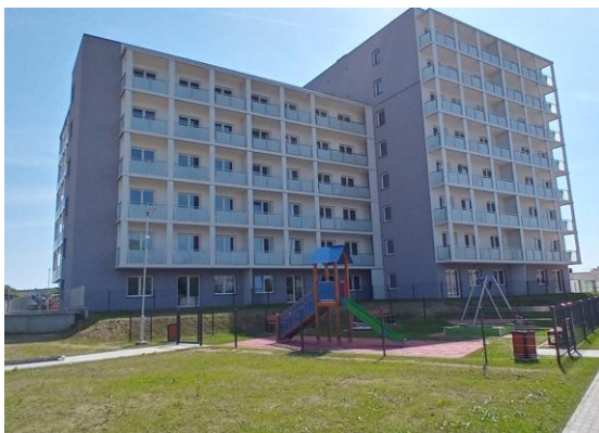
Nowy blok TBS

W 2024 roku, w sektorze inwestycji mieszkaniowych miasto zrealizowało istotne działania mające na celu poprawę jakości życia mieszkańców. Zainwestowano kwotę 780 tys. zł w prace remontowo-budowlane, które objęły 57 mieszkań znajdujących się w zasobach miasta. To kolejny krok w modernizacji infrastruktury mieszkaniowej, który pozwala na poprawę warunków życia krośnian.