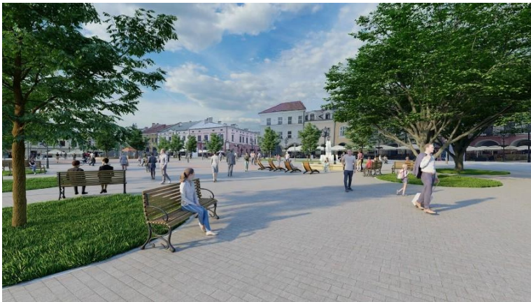
Wizualizacja krośnieńskiego rynku

Projekt obejmuje nasadzenia drzew i zieleni niskiej. Zaplanowane zostaną także elementy małej architektury. Zastosowanie innowacyjnego podłoża strukturalnego, umożliwi lepsze warunki wzrostu roślin oraz zwiększenie pojemności retencyjnej gleby, co pozwoli na efektywne magazynowanie wody opadowej i jej późniejsze wykorzystanie.