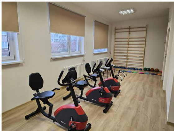
Dzienny Dom Seniora „Senior+”

Placówka dedykowana jest dla 30 seniorów powyżej 60. roku życia. Celem ośrodka jest umożliwienie seniorom aktywnego uczestnictwa w życiu społecznym, co pozwoli im na dłuższe, samodzielne funkcjonowanie w środowisku domowym.