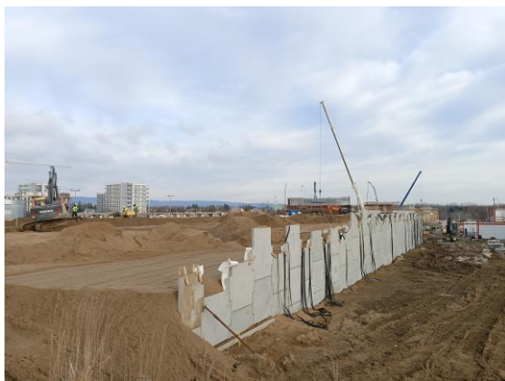
Budowa części drogi „G”

Realizowana inwestycja w części dofinansowana z rezerwy subwencji ogólnej Ministra Finansów w kwocie 20 mln zł, obejmuje budowę drogi G oraz dwóch wiaduktów nad linią kolejową nr 108. Zakończenie prac jest planowane na październik 2025 roku, a projekt ma na celu znaczną poprawę komunikacji w Krośnie, zapewniając nowoczesną i bezpieczną infrastrukturę drogową. Łączna kwota inwestycji to niemal 40 mln zł.