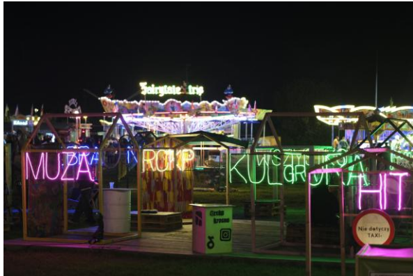
Balony nad Krosnem

i wydarzeń podnoszących kwalifikacje kadry kultury” (KPO), „Młody też potrafi- warsztaty z tradycją dla młodzieży” (NCK).