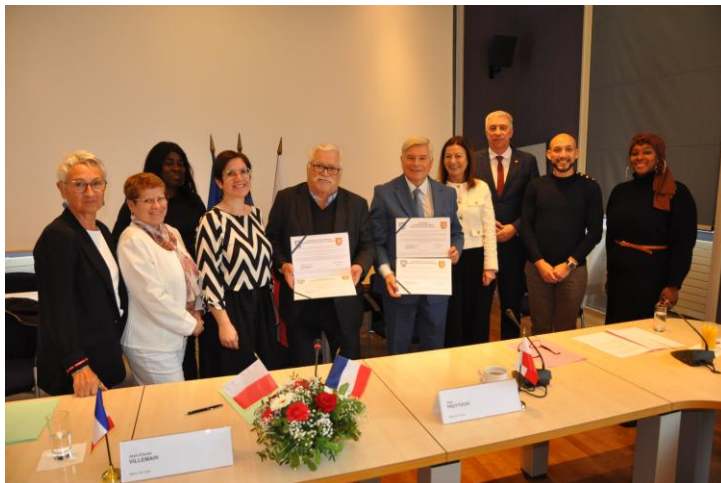
Podpisanie umowy partnerskiej w Creil

(Czechy), Gualdo Tadino (Włochy), Øygdalen (Norwegia) i Marl (Niemcy).