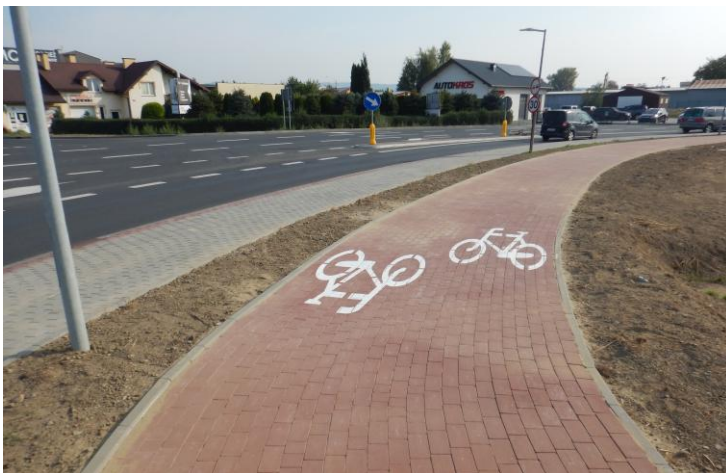
Przebudowa ul. Pużaka wraz z infrastrukturą

W 2024 roku Krosno zainwestowało około 2,3 mln zł w remonty i bieżące utrzymanie dróg oraz chodników. Wśród realizowanych projektów znalazły się zarówno duże inwestycje infrastrukturalne, jak i zadania związane z poprawą komunikacji pieszej i rowerowej.