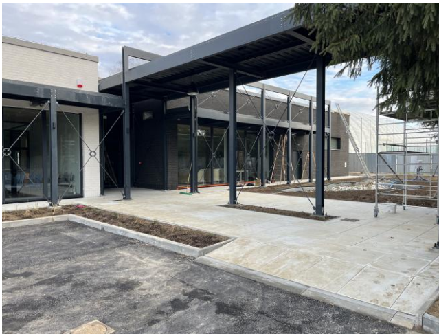
Branżowe Centrum Umiejętności w budowie

Celem projektu jest stworzenie przestrzeni do efektywnej współpracy szkoły z biznesem, uczelniami oraz branżowymi liderami. Nowopowstały budynek BCU będzie wyposażony w nowoczesny sprzęt i technologie, umożliwiające przeprowadzanie szkoleń, kursów oraz certyfikowanych programów podnoszących kwalifikacje zawodowe.