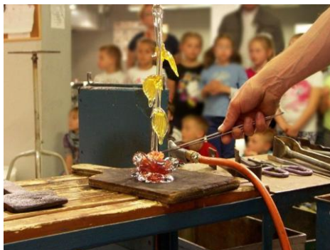
Pokaz hutniczy podczas warsztatów dla dzieci

Rok 2024 w Centrum Dziedzictwa Szkła to prawdziwa uczta dla miłośników sztuki i designu. Odkryto tu aż 17 wystaw, w tym 2 wystawy zewnętrzne w Galerii Portius oraz Regionalnym Centrum Krwiodawstwa i Krwiolecznictwa. W ramach wydarzeń edukacyjnych,