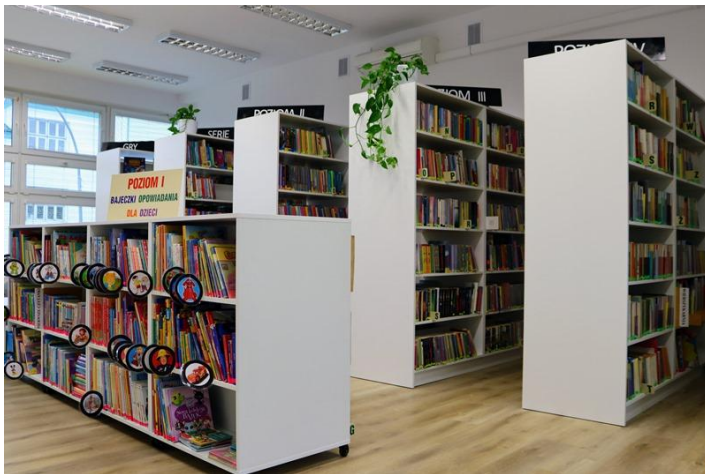
Zmodernizowana przestrzeń KBP Filia nr 4

Krośnieńska Biblioteka Publiczna (KBP) , w skład której wchodzi Biblioteka Główna oraz 7 filii na terenie miasta, to dynamicznie rozwijająca się instytucja kultury, oferująca mieszkańcom Krosna i regionu dostęp do bogatej oferty literackiej, edukacyjnej oraz przestrzeni do spotkań.