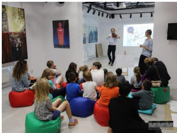
Biuro Wystaw Artystycznych

Biuro Wystaw Artystycznych w Krośnie (BWA) w 2024 r. kontynuowało swoją misję, łącząc wystawy, edukację kulturalną i współpracę międzynarodową. W ciągu roku BWA zorganizowało 21 wystaw, które przyciągnęły prawie 25 tys. odwiedzających oraz zrealizowało 294 warsztaty, w których uczestniczyło ponad 3,5 tys. osób.