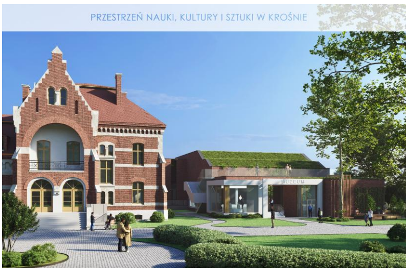
Wizualizacja Pałacu Kaczkowskich

W 2024 r. miasto wraz z Muzeum Rzemiosła przejęło Pałac Kaczkowskich. Na jego remont i zagospodarowanie złożono wniosek o dofinansowanie w ramach Funduszy Europejskich - Program FEniKS. Projekt obejmuje m.in.: rewitalizację obiektu, w tym kultowej „Szklanej grotty” oraz utworzenie nowoczesnej mediateki w ramach KBP.