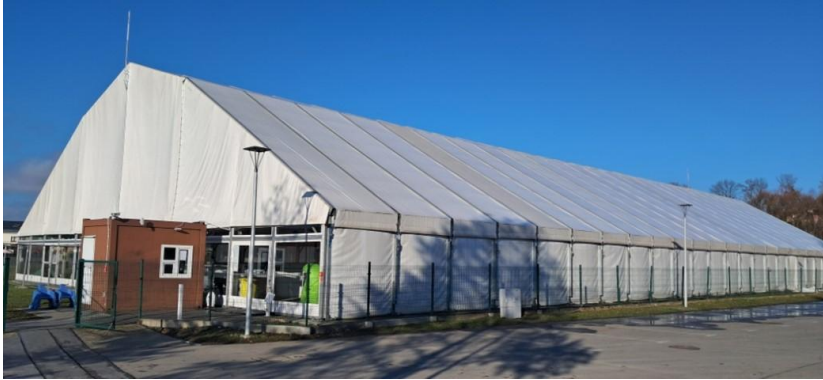
Lodowisko MOSiR Krosno

MOSiR Krosno organizuje liczne wydarzenia sportowe w tym: Turniej Trójek Koszykarskich, „Zimowy Narodowy w Trasie”, Halowy Turniej Piłki Nożnej, Mistrzostwa Polski w Piłce Plażowej, Bieg Konstytucji oraz Nocny Bieg Lotnika. Na stadionie przy ul. Legionów tłumy kibiców przyciągają mecze Karpat Krosno, w tym emocjonujące spotkania 3. ligi i 2. Ekstraligi Speedway z udziałem 6 tys. kibiców.