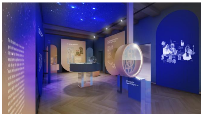
Wizualizacja siedziby Muzeum Rzemiosła