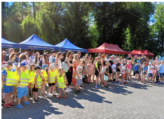
Piknik ekologiczny dla dzieci „EkoKrosno”

W ramach działań podejmowane są inicjatywy zarówno na poziomie miejskim, jak i lokalnym, które promują zrównoważone podejście do kwestii ekologicznych. Są to m.in.: zbiórki elektrośmieci i tekstyliów, projekt „EkoKrosno”, czy „Krosno Wiosną”.