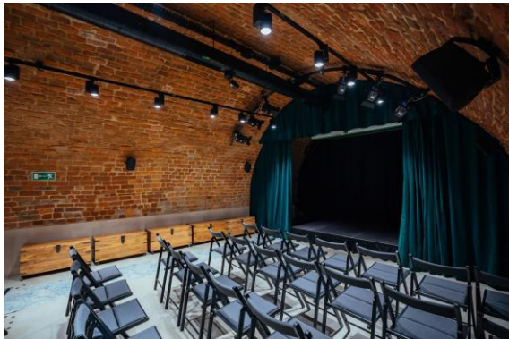
Centrum Aktywności Młodzieży

Centrum Aktywności Młodzieży , nowy dział BWA, odwiedziło ponad 11 tys. osób. Wśród najważniejszych wydarzeń roku 2024 znalazły się: aukcja dzieł sztuki na rzecz WOŚP, wizyta studyjna młodzieży z Norwegii, a także 10. Jubileuszowy Zjazd Sieci BWA z wizytą Ministra Kultury i Dziedzictwa Narodowego Hannę Wróblewskiej.