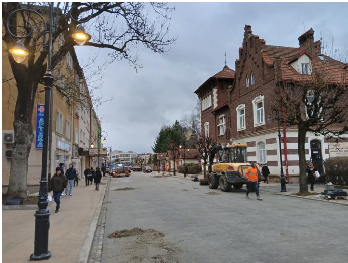
Modernizacja ul. Staszica wraz z infrastrukturą

Wymiana oświetlenia ulicznego i remont ul. Staszica to inwestycje, które znacząco poprawiły jakość życia mieszkańców. Nowoczesne oświetlenie zwiększa bezpieczeństwo i komfort poruszania się, a gruntowna modernizacja ulicy sprawiła, że mieszkańcy mogą cieszyć się lepszą infrastrukturą i bardziej przyjaznym otoczeniem. Wartość inwestycji to ponad 1,9 mln, kwota dofinansowania z RFRD to 1,2 mln.