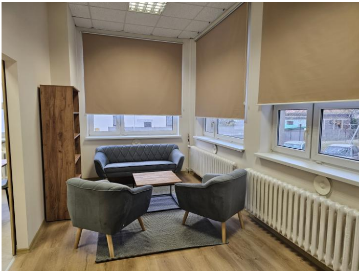
Dzienny Dom Seniora „Senior+”

To miejsce, które sprzyja integracji, samorozwojowi i aktywnemu spędzaniu czasu.