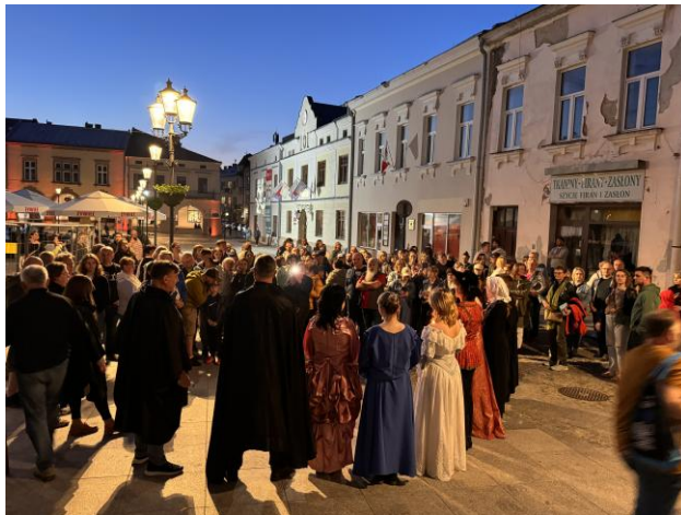
Spacer historyczny ulicami Krosna

W 2024 roku Punkt Informacji Kulturalno-Turystycznej obsłużył ponad 4,5 tys. osób. Zorganizowano także 14 darmowych spacerów, które przyciągnęły niemal 700 uczestników.