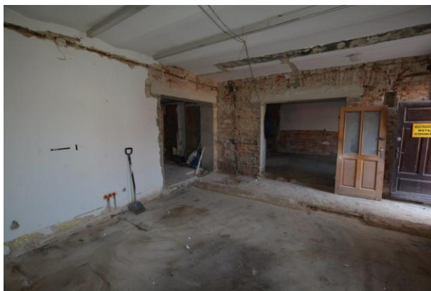
Modernizacja Muzeum Rzemiosła

Remont muzeum to przedsięwzięcie o imponującym zakresie. Efektem końcowym będzie obiekt, który łączy tradycję z nowoczesnością, oferując unikalne doświadczenia edukacyjne i kulturalne.