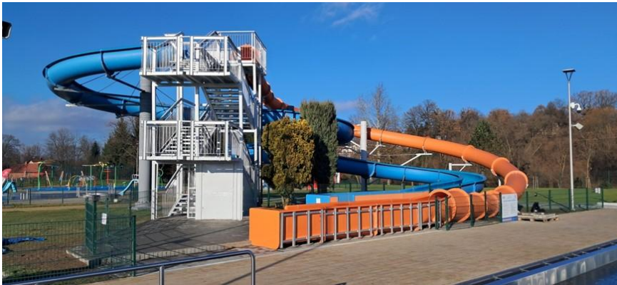
Kompleks Basenów Otwartych przy ul. Bursaki

Zjeżdżalnia wodna znajdująca się w Kompleksie Basenów Otwartych przy ul. Bursaki, została rozbudowana o dodatkową rurę ślizgową. Z kolei dla Zespołu Krytych Pływalni przy ul. Sportowej opracowano Program Funkcjonalno-Użytkowy, który określa zakres planowanej przebudowy oraz działań zmierzających do poprawy efektywności energetycznej obiektu.