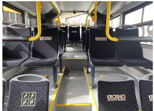
Nowe autobusy MKS Krosno