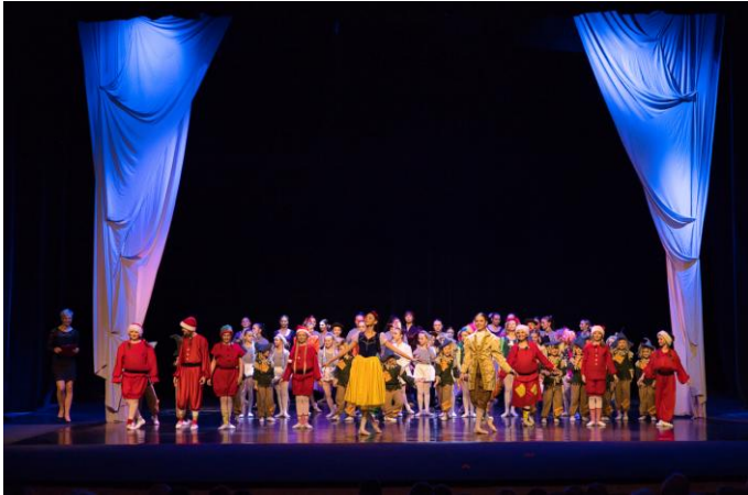
Widowisko baletowe „Królewna Śnieżka”

lokalne, takie jak konkurs grantowy czy projekty łączące życie codzienne z kulturą.