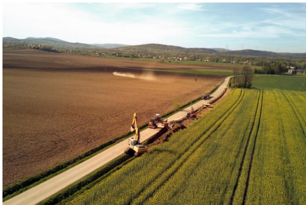
Budowa kolektora sanitarnego