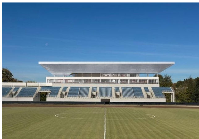
Wizualizacja nowoczesnej trybuny głównej na stadionie przy ul. Legionów

Wartość całkowita projektu to około 30 mln, z czego prawie 18 mln pochodzi z dofinansowania Rządowego Funduszu „Polski Ład”, wkład własny miasta to blisko 11 mln zł. Okres realizacji inwestycji: 12.10.2023 r. – 27.01.2026 r.