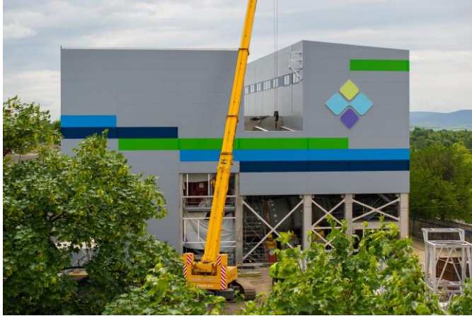
Budowa bloku energetycznego

W 2024 roku Krośnieński Holding Komunalny zainwestował ok. 70 mln zł, realizując kluczowe projekty, które przyczynią się do rozwoju regionu, poprawy jakości życia mieszkańców oraz ochrony środowiska.