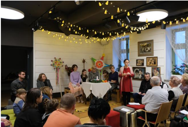
Etnocentrum Ziemi Krośnieńskiej

a miłośnicy śpiewu na próbach Zespołu Śpiewaczego. W roku 2024 to blisko 1000 osób.