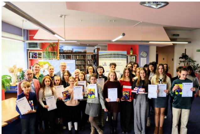
22. edycja Konkursu Literackiej Twórczości Młodzieży

Ponadto zrealizowano konkursy literackie dla młodzieży, w tym 22. edycję Krośnieńskiego Konkursu Literackiej Twórczości Młodzieży oraz 10. edycję Krośnieńskiego Turnieju Jednego Wiersza.