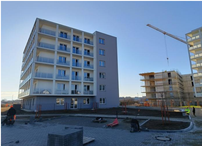
Blok TBS przy ul. Hallera

Cieszy się nim, aż 149 nowych mieszkańców. W 2024 r. miasto wsparło TBS kwotą miliona złotych. Dodatkowo, TBS uzyskał środki z Funduszu Dopłat Banku Gospodarstwa Krajowego (3,5 mln zł) oraz z Rządowego Funduszu Rozwoju Mieszkalnictwa (4,98 mln zł).