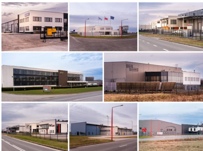
Strefa Inwestycyjna Krosno-Lotnisko

Krosno to miasto, które stwarza doskonałe warunki do rozwoju inwestycji. Strefa Inwestycyjna „Krosno – Lotnisko” to przestrzeń, w której już teraz działa 21 firm, w tym przedsiębiorstwa jak Agencja Rozwoju Przemysłu, Pelmet, Domel Narzędzia, Agencja Reklamowa Media Design czy Garden Steel. Zakończono realizację 5 inwestycji, a kolejne 6 jest w fazie przygotowań. Inwestorzy łącznie utworzyli ponad 750 miejsc pracy w Strefy Inwestycyjnej "Krosno-Lotnisko".