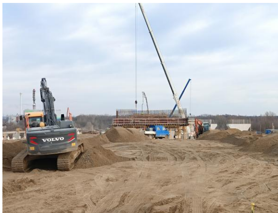
Budowa części drogi „G”

Całkowita wartość zadania to 65,5 mln, z czego 30 ml zł pochodzi z dofinansowania w ramach „Polskiego Ładu.”