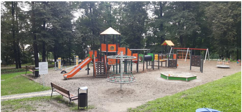
Plac zabaw w Miejskim Parku przy ul. S. Okrzei

Miasto wzbogaciło swoje przestrzenie o nowe nasadzenia roślin m.in. w pasach drogowych przy ulicach: Słonecznej, Legionów oraz Paderewskiego. Zrealizowane zostały także inwestycje w infrastrukturę rekreacyjną. Przykładem jest modernizacja infrastruktury w Parku Miejskim przy ul. S. Okrzei, w tym dostawa i montaż nowych urządzeń na placu zabaw, które zapewniają dzieciom bezpieczną zabawę. Wartość inwestycji przekroczyła 160 tys. zł.