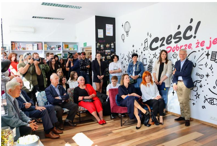
Strefa Młodych w KBP

Krośnieńska Biblioteka Publiczna realizowała w 2024 roku szereg projektów, które promowały czytelnictwo, kulturę oraz lokalne tradycje. Wśród nich warto wyróżnić: „Krośnianie! Wielkie Czytanie – Festiwal Literatury dla Dzieci i Młodzieży”, „Dziedzictwo warte zachowania!”, „Biblioteka(rz) = rozwój, dialog, kreatywność” – bibliotecznej oferty. KBP zrealizowała także wydarzenia, które aktywnie promowały region, takie jak Narodowe Czytanie „Kordiana” Juliusza Słowackiego. KBP kontynuowała także ogólnopolską akcję „Mała Książka – Wielki Człowiek”, w ramach której najmłodszy otrzymali Wyprawki Czytelnicze oraz Kartę Małego Czytelnika, zachęcając dzieci do regularnych wizyt w bibliotece.