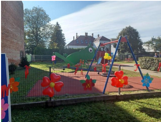
Plac zabaw przy Przedszkolu Miejskim Nr 4

Projekt, którego celem było przystosowanie przestrzeni do potrzeb dzieci z różnymi rodzajami niepełnosprawności, stworzył unikalną strefę zabawy, edukacji i integracji, otwartą dla wszystkich maluchów. Dofinansowanie remontu sal przedszkolnych oraz zakupu wyposażenia znacznie podniosło standard Przedszkola Miejskiego Nr 4. Całkowita wartość inwestycji to prawie 300 tys. zł.